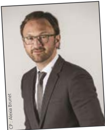
Par Patrick Mignola

Pour le Maire que je suis, les 20 ans du Relais assistantes maternelles, que nous avons célébré le 14 novembre dernier, fut un vrai bonheur !