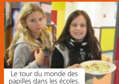
Le tour du monde des papilles dans les écoles.