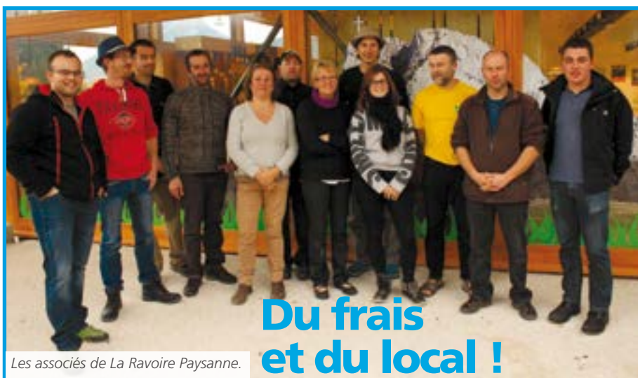
Les associés de La Ravoire Paysanne.