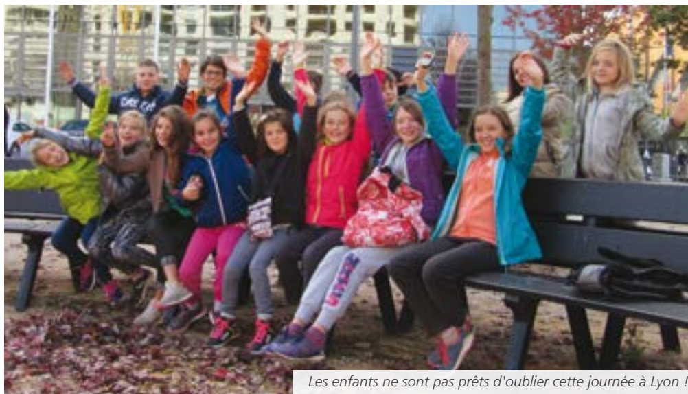
Les enfants ne sont pas prêts d'oublier cette journée à Lyon !