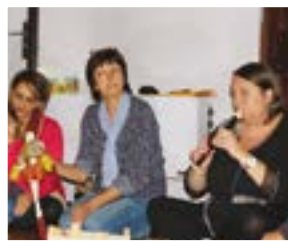
Musipouce en 2015