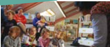
Les premiers raconte-tapis en 2010