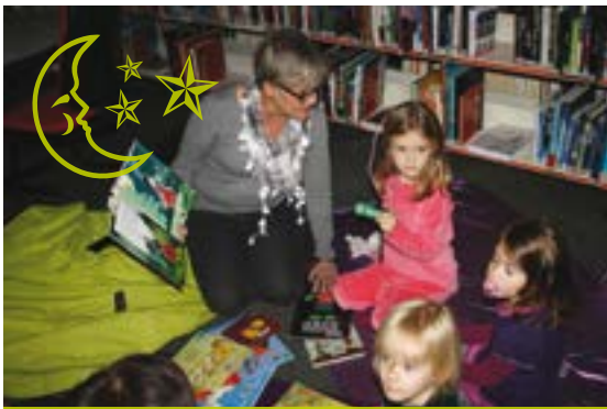
18 novembre : pyjamas et doudous étaient de sortie pour une soirée lecture tout en douceur dans la pénombre de la bibliothèque...