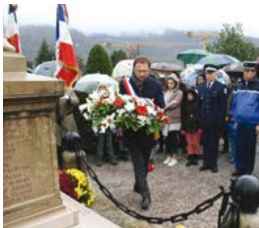
Cérémonie du 11 novembre. Au son de la Marseillaise, jouée par l'école de musique, les participants se sont recueillis en souvenir des morts pour la France lors de la première grande guerre mondiale.