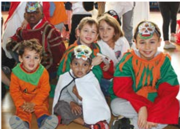
Les enfants de l'AMEJ ont fêté Halloween dignement, en élisant à l'applaudimètre le plus beau costume !