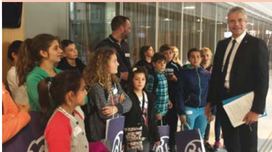
Les jeunes élus ont rencontré Laurent Wauquiez, le Président de la toute nouvelle région Auvergne-Rhône-Alpes.

Et puis petite cerise sur le gâteau, au cours de la visite des bâtiments, les jeunes croisent le Président du Conseil régional en personne, Laurent Wauquiez, qui, tout naturellement, s'arrête et les salue.