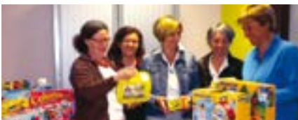
Ouverture du ludoram en 2014