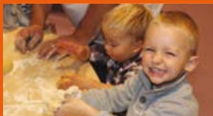
Atelier pâtisserie au multi-accueil Les Lutins.