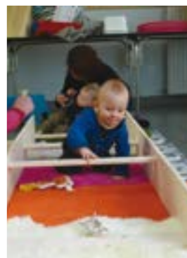
Les ateliers dont la motricité depuis l'ouverture !