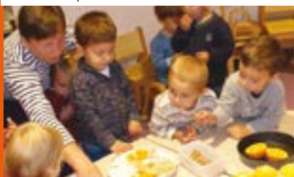
Les enfants du RAM font de plein de nouvelles saveurs !