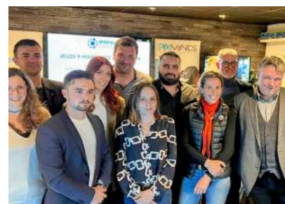
Consortium d'ingénierie d'entreprise de Réseau Académie