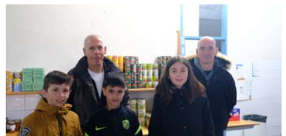
De jeunes élus prêtent main-forte aux bénévoles des Restos du Cœur

Dans les mois à venir, plusieurs actions seront mises en place par les jeunes conseillers : une randonnée intergénérationnelle, une action au sein des Restos du Cœur et un temps de ramassage des déchets autour de la rivière la Mère.