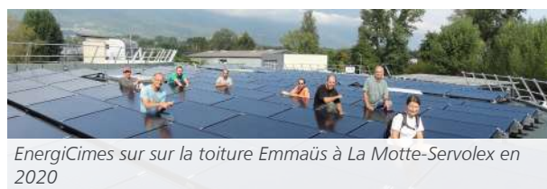
EnergiCimes sur sur la toiture Emmaüs à La Motte-Servolex en 2020

toits des acteurs publics ou privés, sensibilisés à la thématique du solaire, répondant présents et revend l'énergie créée par la suite. Ainsi, grâce à ce système, la société a pu mettre en service 6 installations photovoltaïques, totalisant plus de 1000 panneaux solaires permettant de couvrir l'équivalent des besoins de 180 familles. Dans les années à venir, la société souhaite augmenter le nombre de panneaux solaires posés et ne s'interdit pas de diversifier ses activités en proposant, par exemple, des actions de sensibilisation auprès de divers publics.