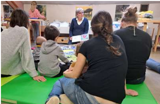
Séance raconté-tapis du mercredi 29 mars à la médiathèque