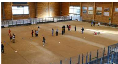
Différents ateliers de la boule lyonnaise au boulodrome de La Ravoire