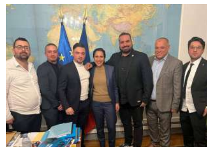
Les membres de Réseau Académie avec Sarah Elhaïry : secrétaire d'État