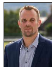
Alexandre Gennaro, Maire de La Ravoire

“ Plus de 5 millions seront investis dans des projets visant à améliorer le quotidien des ravoiriens sans avoir recours à l'augmentation de la part communale des impôts. ”