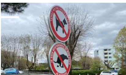
Plusieurs panneaux de ce type ont été installés dans la commune

Avec l'arrivée des beaux jours et afin de maintenir notre ville propre et accueillante, nous vous rappelons qu'il est important de tenir votre compagnon à quatre pattes en laisse. En effet, pour la tranquillité et la sécurité de tous, un chien bien tenu (ou tout autre animal) permet une balade sans déboire aussi bien pour les promeneurs que pour leurs animaux. Ainsi, il ne sera pas considéré comme divaguant (errant) et le maître ne fera donc pas l'objet d'amende ou encore de frais imprévus (frais de récupération auprès de la fourrière, identification).