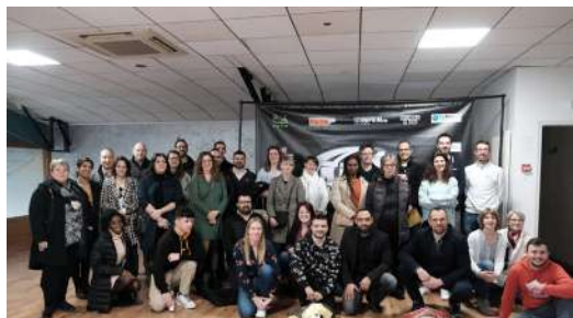
Le réseau commerces et entreprises lors du p'tit déj organisé le 13 Mars chez Fitko

LE rendez-vous incontournable des professionnels ravoiriens